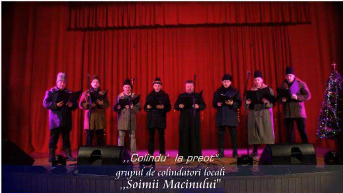
Concert Colinde Macin 2020