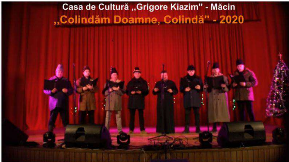
Concert Colinde Macin 2020